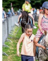
Rondje ponystappen met Ponyclub Ollie.

„Hij heeft een verrassing voor ze. Dit de kleine trailer springen twee jonge bordercollië. „Kom ze maar aaien“, roept de schapendrijver uit Heterren.