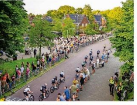
Wielersportvereniging Santpoort-Noord. Foto: Kees de Boer

„Het is heel leuk om te rijden. Het is heel leuk om te rijden. Het is heel leuk om te rijden.“