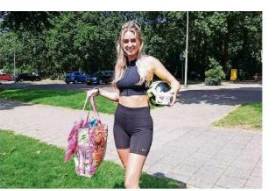
Med met haar tas vol met sauzen en kwark.

Santpoort-Noord ■ Voetgof is een leuk spel waarbij het bij maken centraal staat. Tijdens dit ludieke spel dat onderdeel is van het programma van Dorpsfeest Santpoort heeft team 'De Meisjes van Plezier' daar geen enkele moeite.