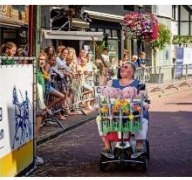
De Vleesket met markten Geerze en Zilva in actie.