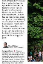
Wielersportvereniging Santpoort-Noord.