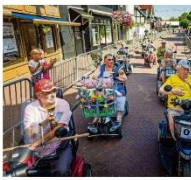
Eerste van de deuren van het rijgtoeren in coöperatie.