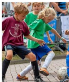
Straatvoetbal (2022) buiten.